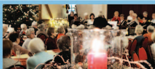
Ein Nachmittag voller Wärme und Begegnung – Senioren-Weihnachtsfeier 2025

Neues Jahr. Neue Feuerwehr. Ein starkes Zeichen für unsere Stadt.