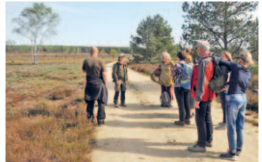
Landschaftsführung in der Heidelandschaft bei Kraupa

Die Kosten der Schulung werden nahezu vollständig über eine LEADER-Förderung abgedeckt. Die Teilnehmerzahl ist begrenzt. Die Termine, Konditionen und Anmeldebedingungen finden Sie unter https://heidebogen.eu/start