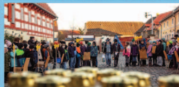
Ein Funke Mut – Friedenslicht zum achten Mal im Hort empfangen