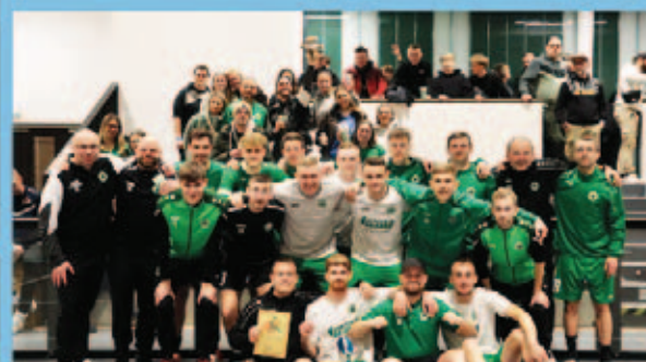
32. Hallenturnier des FV Gröditz 1911 um den Pokal der Gröditzer Autohaus KG