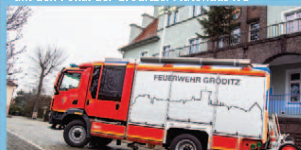
Neuer Florian für Gröditz – Löschgruppenfahrzeug LF20 in Gröditz angekommen