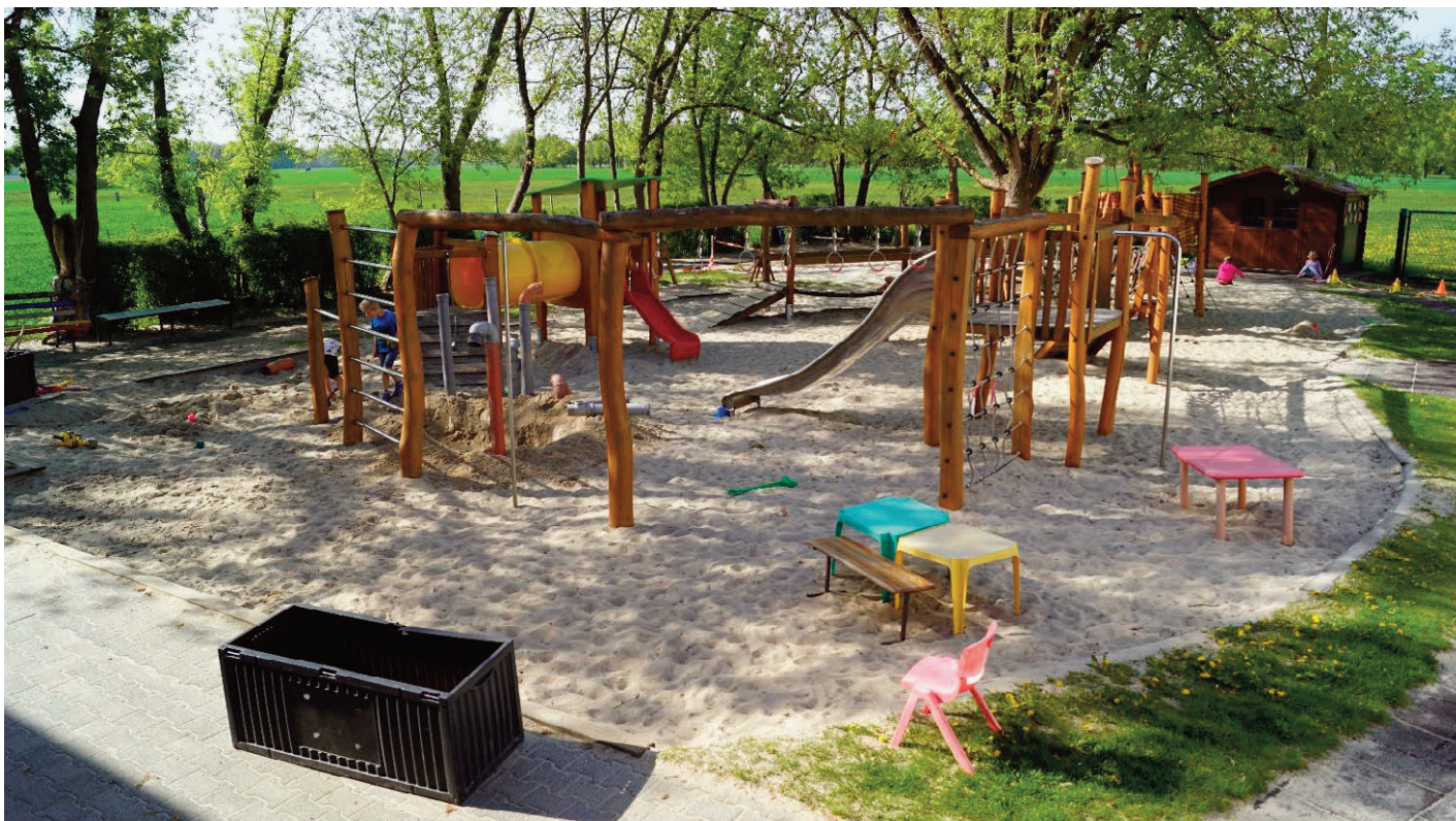
Spielplatz _ geplant: Nutzung auch für die Freizeit der Kinder und Bürger