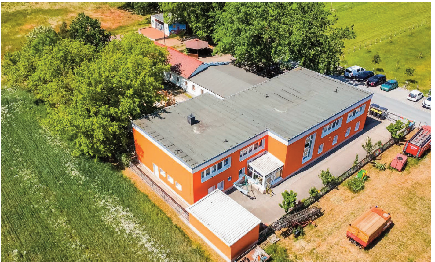
Kita und Vereinsgebäude, oben mittig: die Bühne und Festwiese, oben rechts: Lage Fußballplatz