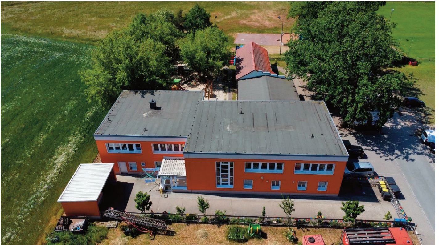
Kita und Vereinsgebäude, im Hintergrund die Bühne und Festwiese