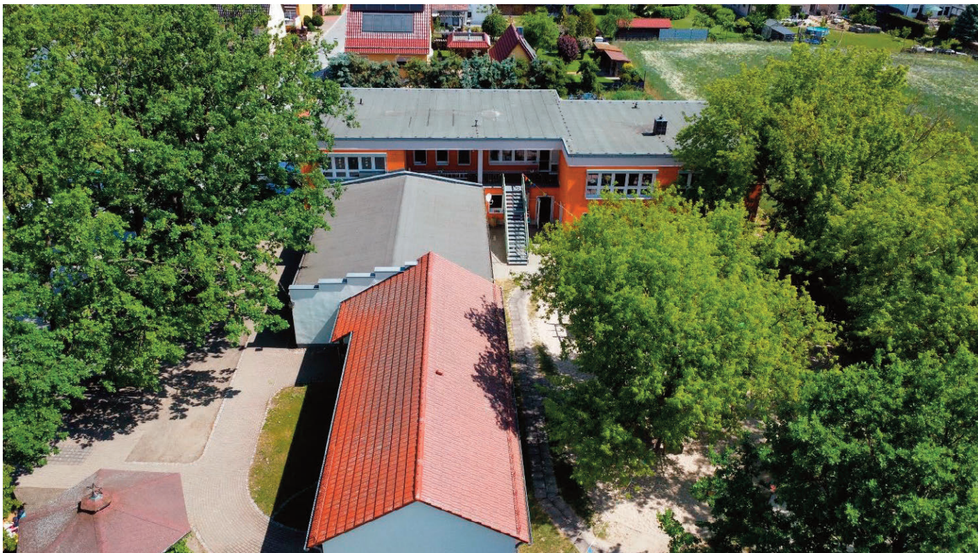
Kita und Vereinsgebäude (Blick aus Richtung Festwiese, links Außenbereich/Sitzbereich, rechts: Spielplatz)